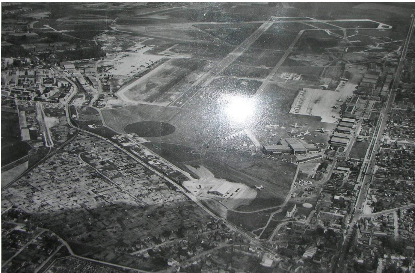
Aéroport de Dugny-Le Bourget au milieu des années cinquante (le Nord est en haut de l'image)

La partie de Dugny visible sur l'image en haut à gauche montre la base aéronavale en fin de construction, la base aérienne 104, la caserne De Rose et la cité-jardin l'Eguiller en brique rouge dont les résidents dans leur majorité étaient des personnels civils et militaires ayant une activité dans l'aviation.