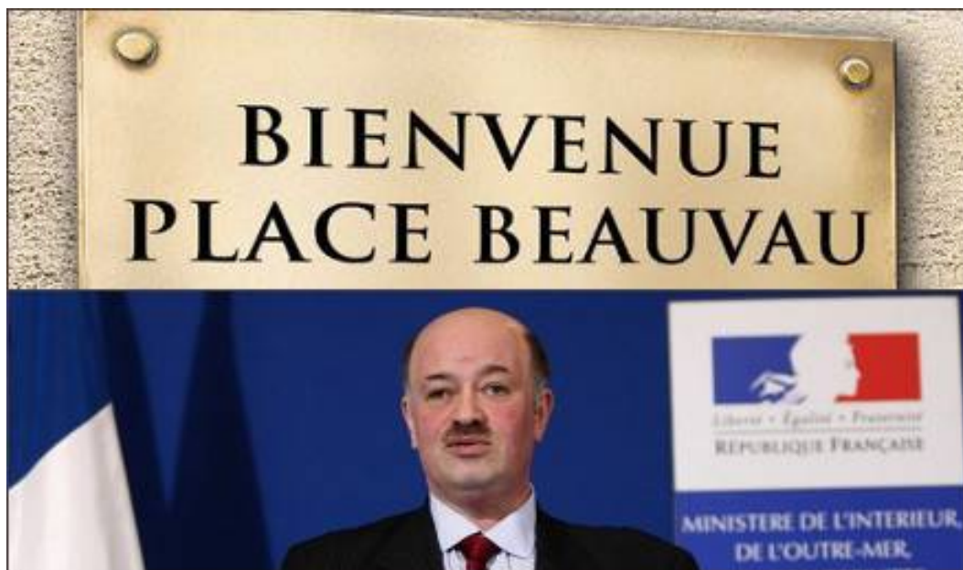
Le livre Bienvenue Place Beauvau (mars 2017) et Alain Bauer