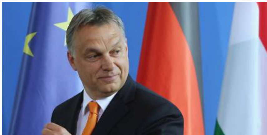
Viktor Orbán, Premier ministre hongrois

Sur antipour.com : http://antipour.com/a/leurope-la-hongrie-la-france.htm