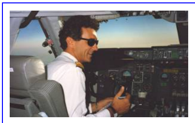
Le Web général