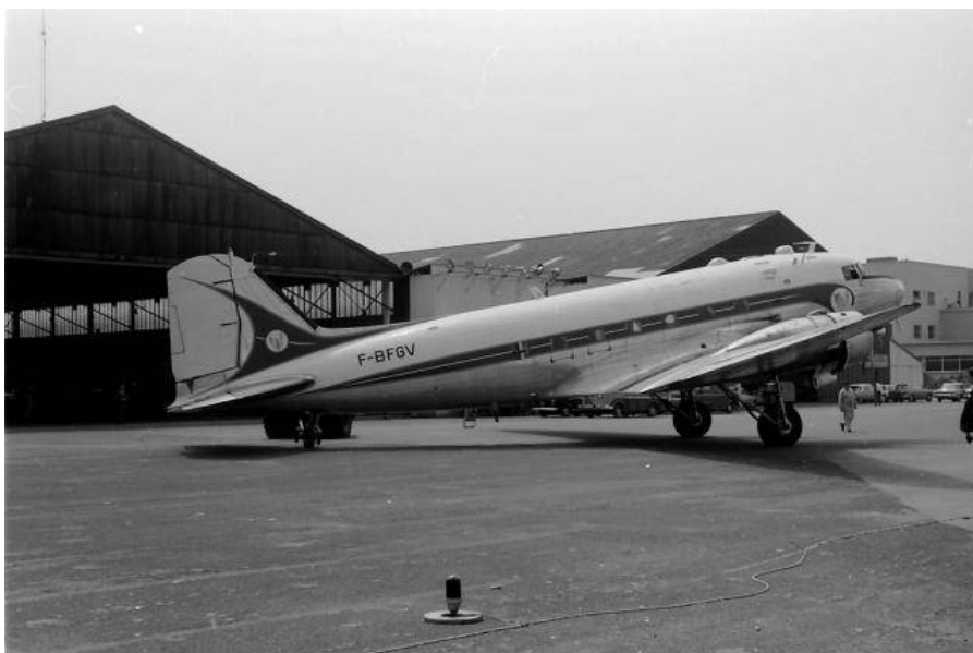
Le Bourget : DC-3 F-BFGV du SGACC devant le hangar du SGACC (début des années soixante)

L'aviation, je suis tombé dedans à ma naissance en 1950. A Dugny, dans une enclave entre les pistes du Bourget, où j'ai passé toute mon enfance (dans les immeubles en briques rouges le long de la piste Nord-Sud, à l'extrémité sud), à quelques centaines de mètres du hangar du Secrétariat général à l'aviation civile et commerciale, devenu la Direction générale de l'aviation civile, où travaillait mon père (le hangar S11, avant-dernier coté sud). J'ai grandi dans ce hangar au milieu des DC3, d'un DC4, de divers autres avions et de prototypes en phase finale des vols d'essais (vols de certification en ligne). J'étais de temps en temps passager à bord de ces appareils.