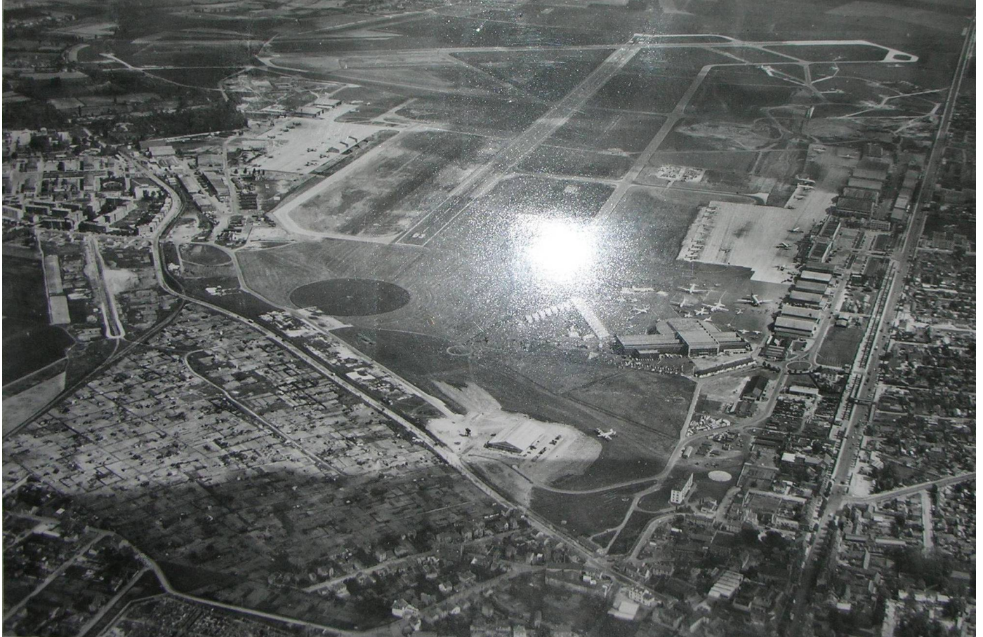
Aéroport de Dugny-Le Bourget au milieu des années cinquante (le Nord est en haut de l'image)

La partie de Dugny visible sur l'image en haut à gauche montre la base aéronavale en fin de construction, la base aérienne 104, la caserne De Rose et la cité-jardin l'Eguiller en brique rouge dont les résidents dans leur majorité étaient des personnels civils et militaires ayant une activité dans l'aviation.