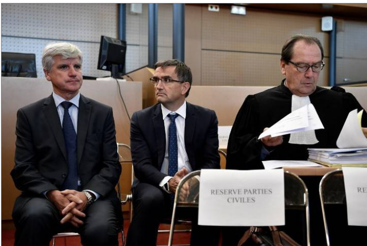
Plissonnier, Broseta, Charrière-Bournazel

Dans l'industrie automobile on assiste à des rappels de véhicules, parfois par centaines de milliers, voire beaucoup plus. Le 26 octobre 2016 Toyota a annoncé le rappel de près de six millions de véhicules. Dans d'autres secteurs d'activité on agit de même. Les décisions prises en raison des défauts récents des Galaxy Note 7 de Samsung montrent un bel exemple de mesure de précaution, alors qu'il n'y a eu ni mort ni blessé. Pourquoi continuerait-on dans l'aérien à mentir sur les causes des incidents graves et des accidents et à cacher la vérité sur des défauts de conception, sachant que les conséquences sont des morts inutiles par centaines ?