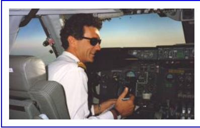
Le Web général