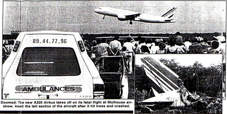
Doomed: The new A320 Airbus takes off on its fatal flight at Mulhouse airshow. Inset: the tail section of the aircraft after it hit trees and crashed.

Two facts are now established about the accident.