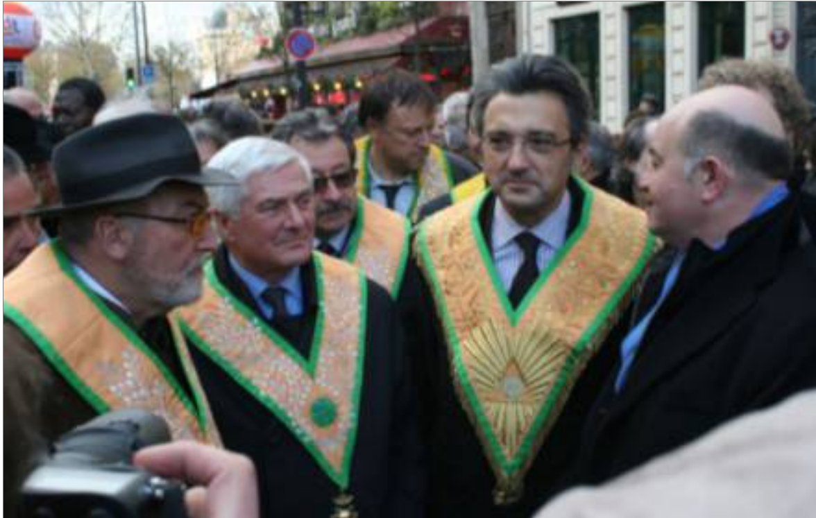
Premier à droite : Alain Bauer, ex-grand maître du Grand Orient de France (photo prise en décembre 2013)

Une mafia est une organisation criminelle dont les activités sont soumises à une direction collégiale occulte et qui repose sur une stratégie d'infiltration de la société civile et des institutions. On parle également de système mafieux. Les membres sont appelés « mafieux » (sans distinction de nombre) ou parfois « mafiosi », d'après le nom italien (au singulier : « mafioso »). En général, la mafia préfère recourir à l'intimidation, la corruption ou le chantage plutôt qu'à la force pour contraindre ceux qui lui résistent. De cette manière elle attire moins l'attention du grand public sur elle. Mais parfois elle recourt à la destruction de biens, à l'agression physique, à l'assassinat.