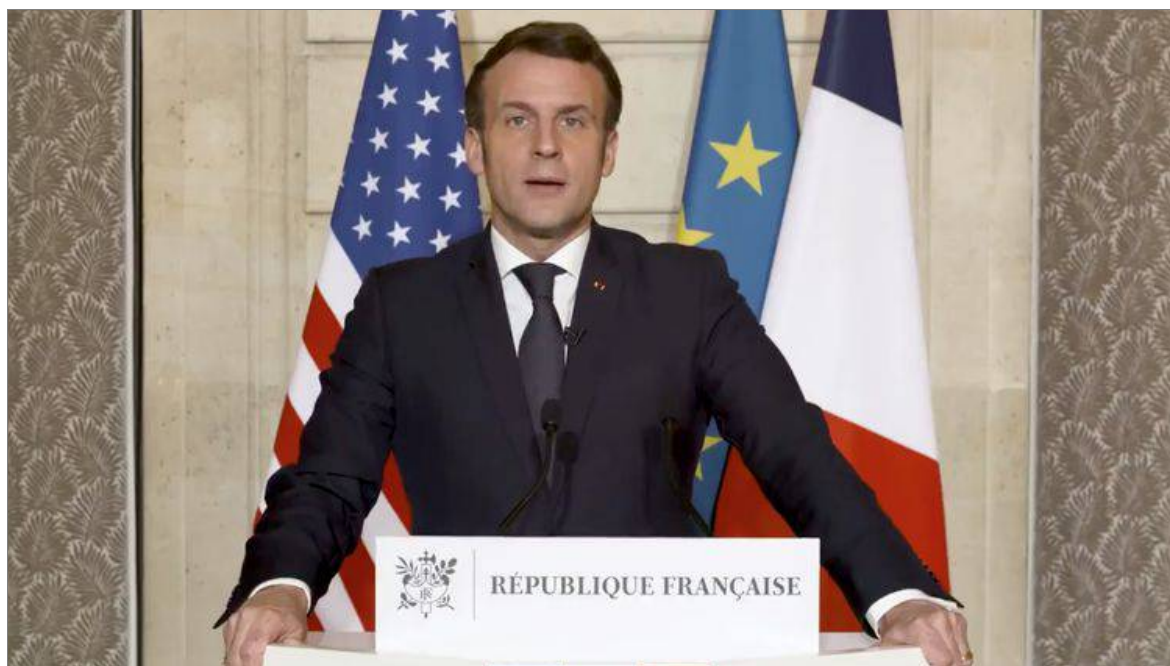
7 janvier 2021 : Emmanuel Macron, défenseur universel de la démocratie