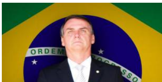
Jair Bolsonaro, président élu du Brésil

http://franceleaks.com/hollande/florence-de-changy-et-jean-luc-melenchon-norbert-jacquet-29-octobre-2018.pdf