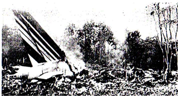
Erreur humaine ou défaillance technique ? Plusieurs inégalités graves entachent l'honnêteté de l'enquête.